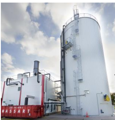
Veghel, Niederlande, Baujahr 2014 Abwasserbehälter 1.255 m 3 Werkstoff 1.4404