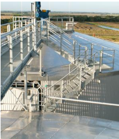
Isolierung, Manteltreppen, Laufstege