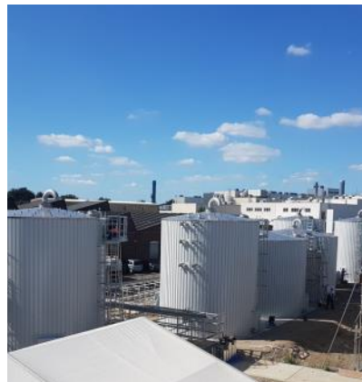
Heinsberg, Baujahr 2019 RAW Tank 2x 188 m 3 NT Tank 138 m 3 / EF Tank 246 m 3 Werkstoff Fusion, Trifusion