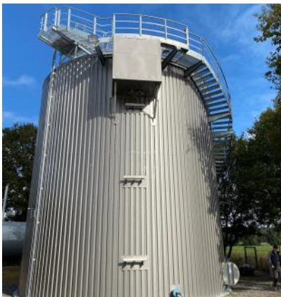
Drensteinfurt, Baujahr 2020 Faulbehälter 659 m 3 Werkstoff 1.4404