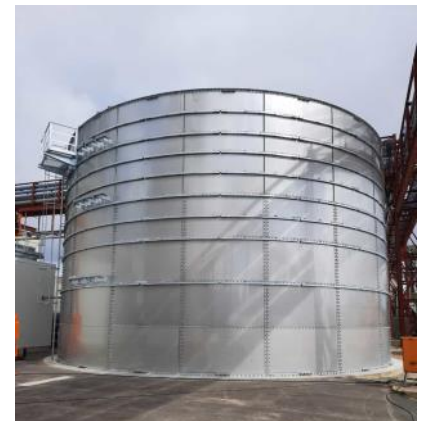
Beeskov, Baujahr 2019 Bioreaktor 1.611 m 3 Werkstoff V2A