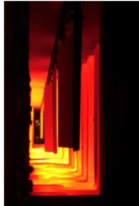
Emaillierung wird eingebrannt