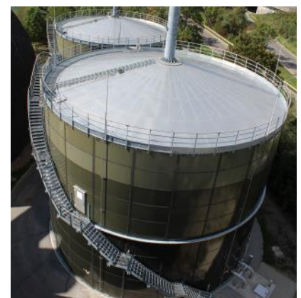
Mainz, Baujahr 2015 Niederdruckgasspeicher 55 mbar 2.500 m 3 & 3.700 m 3 Werkstoff Emailliert, V2A, V4A